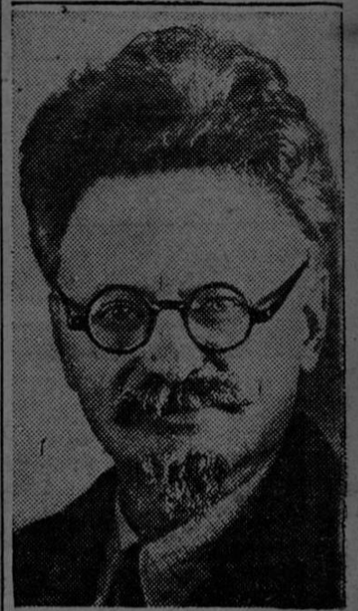
Trotsky, el leader ruso, que no encuentra casa donde vivir y para cuya entrada en Costa Rica, la Asociación Radical de Estudiantes hace gestiones.